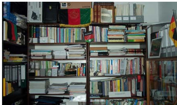
Unsere Bücher, Zeitungs- und Zeitschriftenversammlung

Mit unserer Arbeit wollen wir Frieden, Entwicklung, Bildung und Gesundheit in Afghanistan fördern.